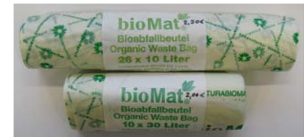
1 Rolle Biobeutel (26 Stück): 2,50 €

Wer noch Fragen zum richtigen Kompostieren oder Probleme mit der Bio-Tonne hat, kann sich an Frau Buschhüter, Tel. 05454 911-139 oder per e-Mail an a.buschhueter@hoerstel.de wenden