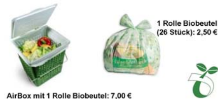
AirBox mit 1 Rolle Biobeutel: 7,00 €

Eine Rolle mit 26 Stck. 10-Ltr.-Beuteln = 2,50 €, oder eine AirBox inkl. einer Rolle 10-Ltr.-Beutel = 7,00 €, oder eine Rolle mit 10 Stck. 30-Ltr.- Beuteln = 2,00 €. Diese Beutel entsprechen der Euronorm (EN 13432) und können im Kompostwerk Saerbeck innerhalb kurzer Zeit biologisch abgebaut werden.